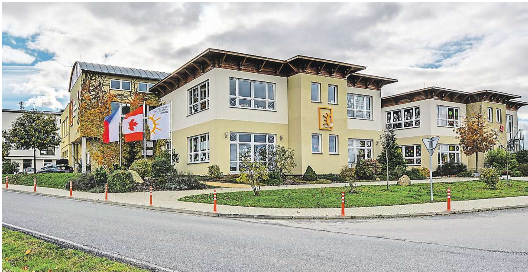
Kousek za Prahou Škola sídlí těsně za jižní hranicí Prahy v Jesenici. Z metra „C“ Opatov to trvá autobusem jen jedenáct minut.

J. S. Jsme škola, která spadá pod Ministerstvo školství České republiky, naši studenti tedy musí naplnit cíle předepsané pro české základní a střední vzdělávání. V mateřské škole a na prvním stupni základní školy využíváme také osnovy kanadské provincie Alberta, které jsou známy svou kvalitou a výsledky v rámci mezinárodního srovnávání. Na druhém stupni a gymnáziu pak učíme vybrané předměty také podle mezinárodních standardů Cambridge International Examination. Naši maturanti končí s českou a mezinárodně uznávanou cambridgeskou maturitou, jsou tedy plně připraveni ke studiu na univerzitách v Česku i v zahraničí. Díky své vynikající jazykové vybavenosti a nadstandardním komunikačním dovednostem se naši studenti hladce zapojují do mezinárodních projektů a spolupracují se zahraničními partnerskými školami.